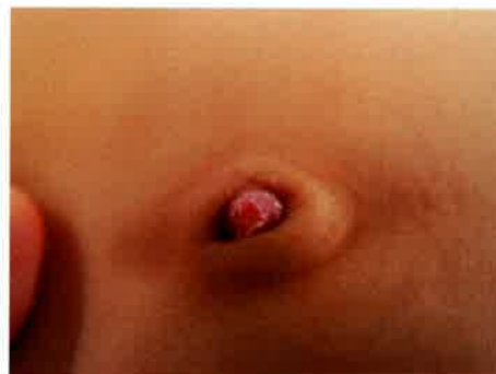
生後2ヶ月の尿膜管遺残症